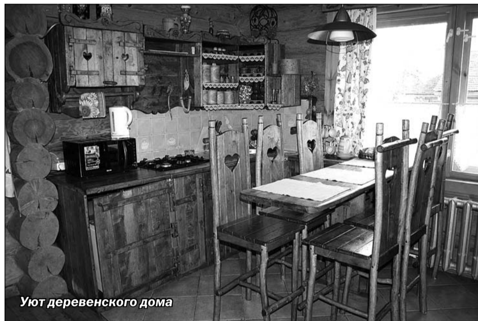
Уют деревенского дома

При поддержке власти и кредитных структур на территории нашего района могло бы появиться множество гостевых домиков, что стало бы прекрасной рекламой семейного отдыха на Валдае.