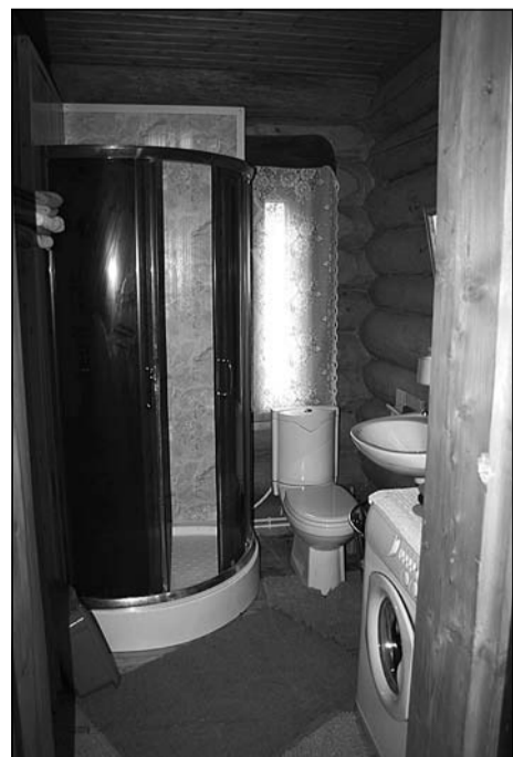
Современные условия для дорогих гостей

машинка. Всё сделано для комфортного отдыха, для человека. Не замечаешь сам, как начинаешь думать не только об отдыхе, но и жизни в таком замечательном месте.