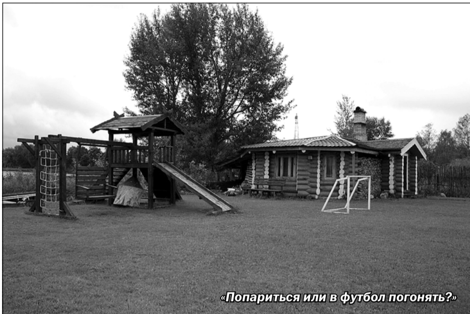
«Попариться или в футбол погонять?»

Продолжая интересную тему развития туризма на Валдае, сегодня мы разберёмся с таким понятием, как «гостевой дом». От теории мы плавно перейдём к практике и на деле узнаем, в каких условиях отдыхают гости нашего города — те, кто шумным гостиницам предпочитают уединение.